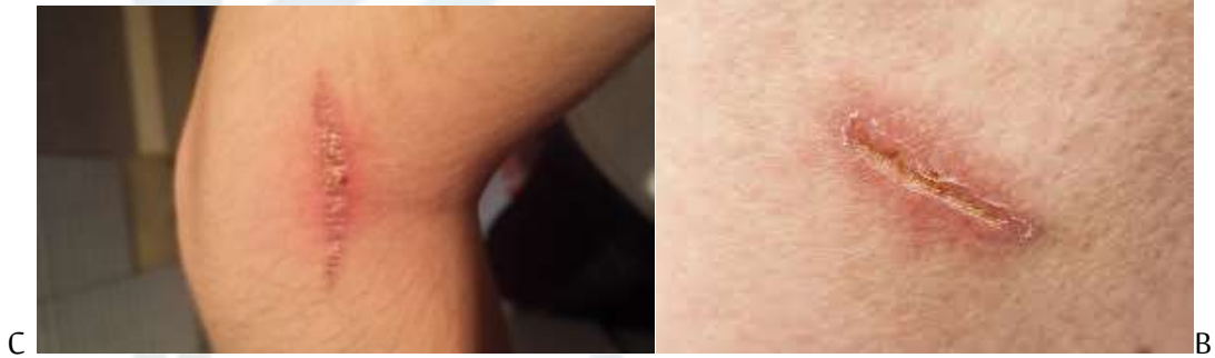
الشكل (43): ندبتين ضخاميتين