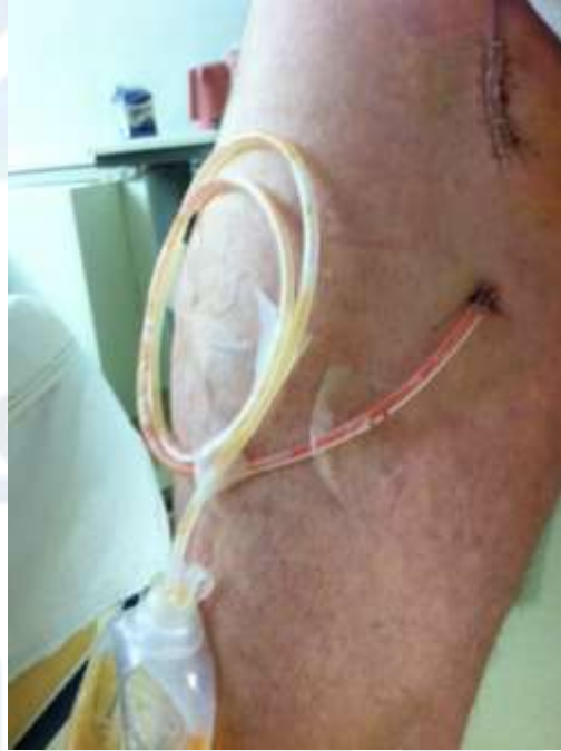
الشكل (46): نزح بسيط لمنطقة جرح وذلك باستعمال أنبوب مطاطي وكيس جمع سائل

أ- منزح أنبوبي من الكاوتشوك: وهو أنبوب له أقطار مختلفة من 4 - 20 ملم، وقد يحتوي أحياناً على عدة ثقوب جانبية الشكلين (46 - 47).