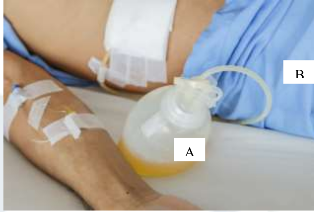
الشكل (47) نزح جرح لاحظ: