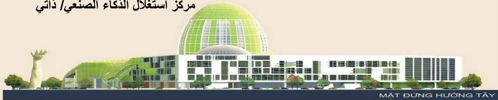
MẶT ĐŨNG HƯỚNG TÂY