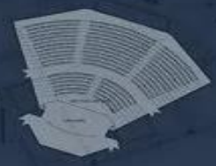
MẶT BẰNG TẦNG 4 TỈ LỆ 1:300