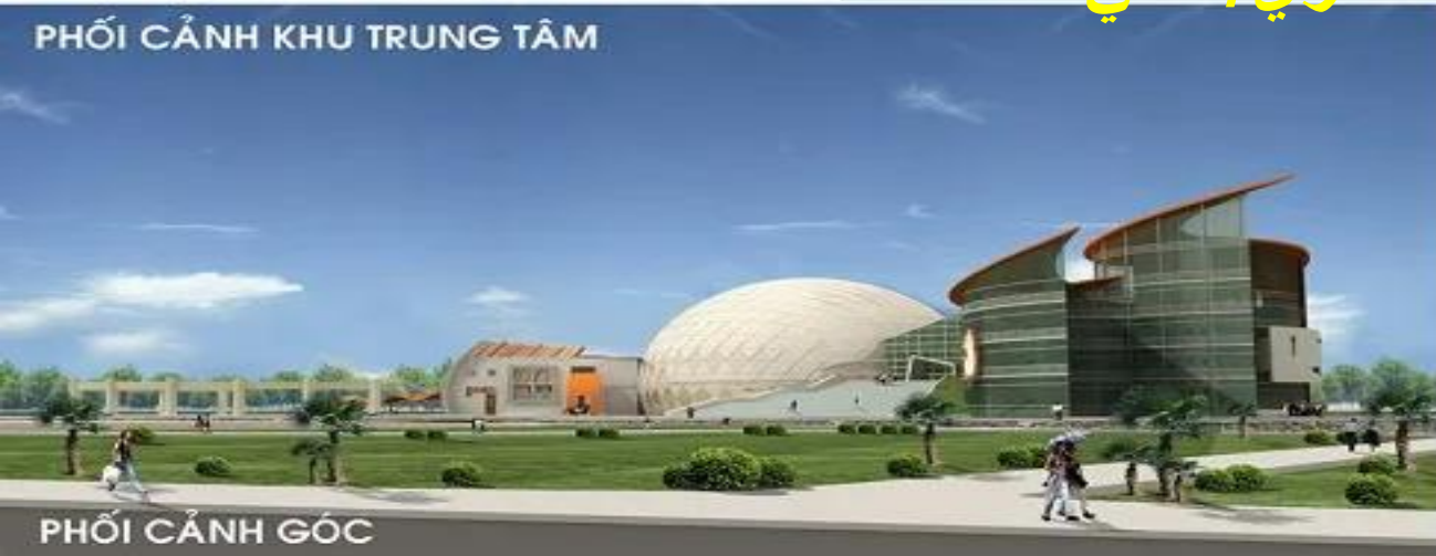
PHỐI CẢNH GÓC