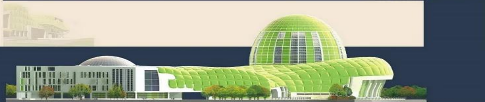
MẶT ĐŨNG HƯỚNG NAM