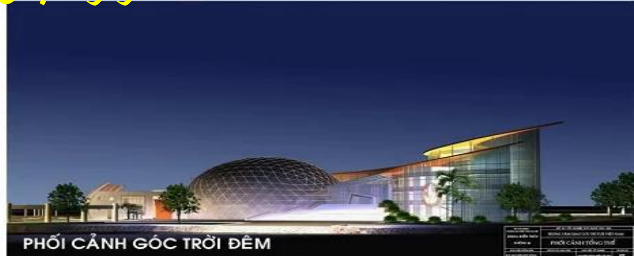
PHỐI CẢNH GÓC TRỜI ĐÊM