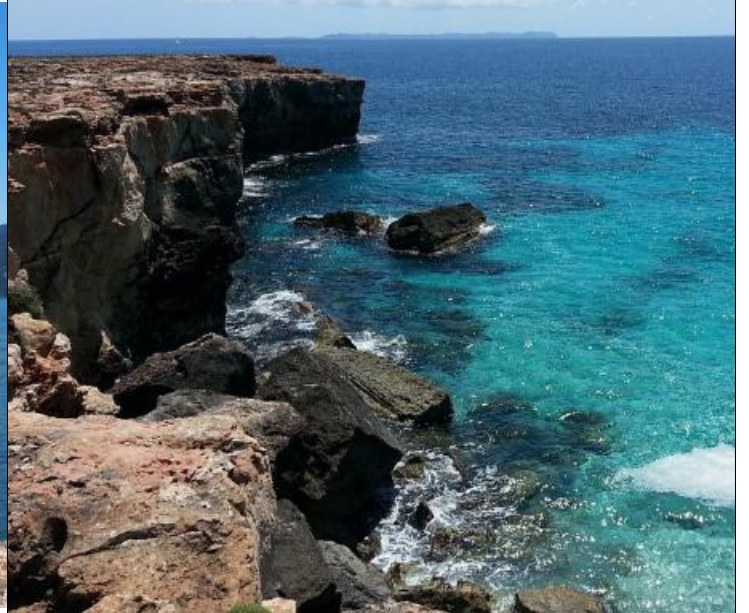
CC0 Creative Commons